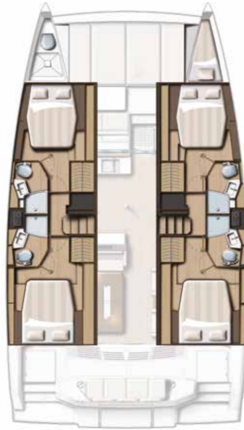
4 CABIN VERSION / 4 BATHS