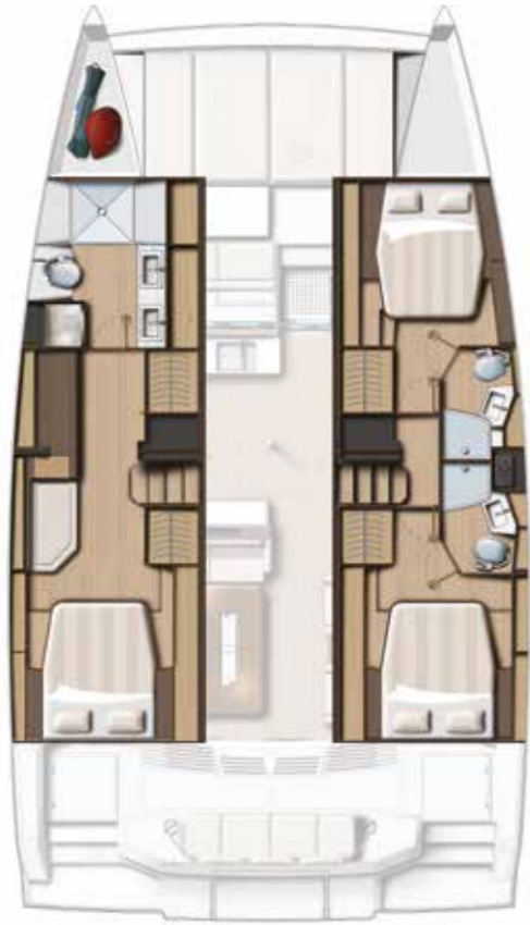
3 CABIN VERSION / 3 BATHS