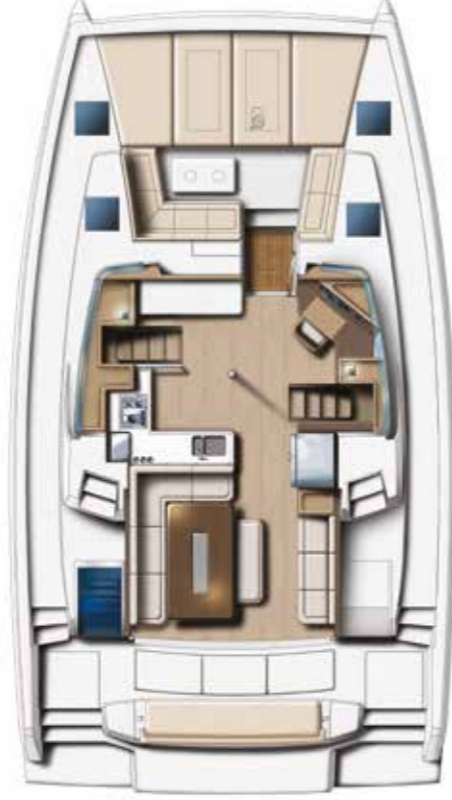
COCKPITS AND SALOON Cockpits & salon