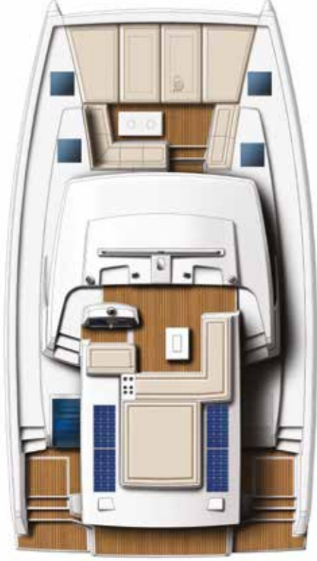
DECK AND FLYBRIDGE (optional teak) Pont et flybridge (teck en option)