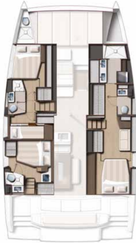
4 CABINS (OWNER) / 3 BATHS VERSION Version 4 cabines / 3 sdb (coque propriétaire)