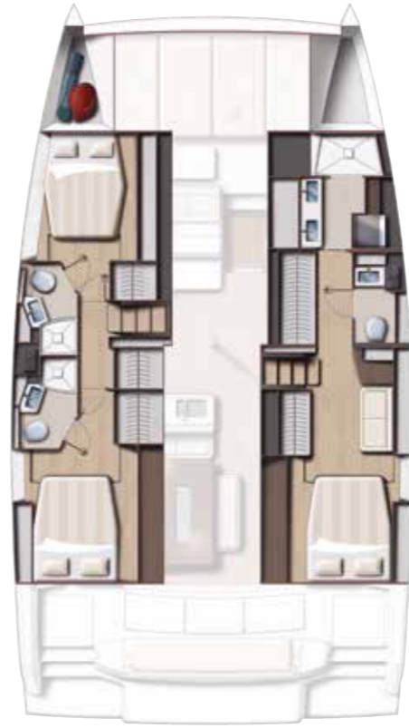
3 DOUBLE CABINS / 3 BATHS VERSION Version 3 cabines doubles / 3 sdb