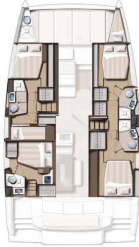
5 CABINS (4 DOUBLE + 1 TWIN) / 4 BATHS VERSION Version 5 cabines (4 doubles + 1 twin) / 4 sdb