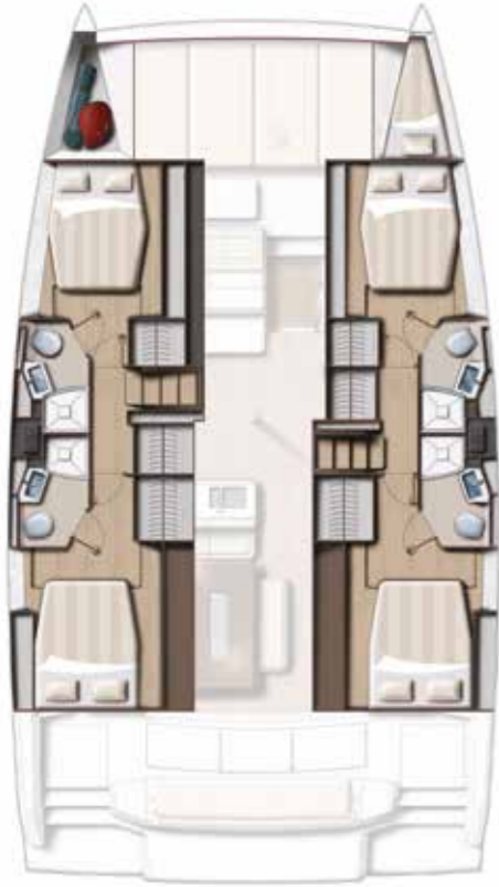
4 DOUBLE CABINS / 4 BATHS VERSION Version 4 cabines doubles / 4 sdb