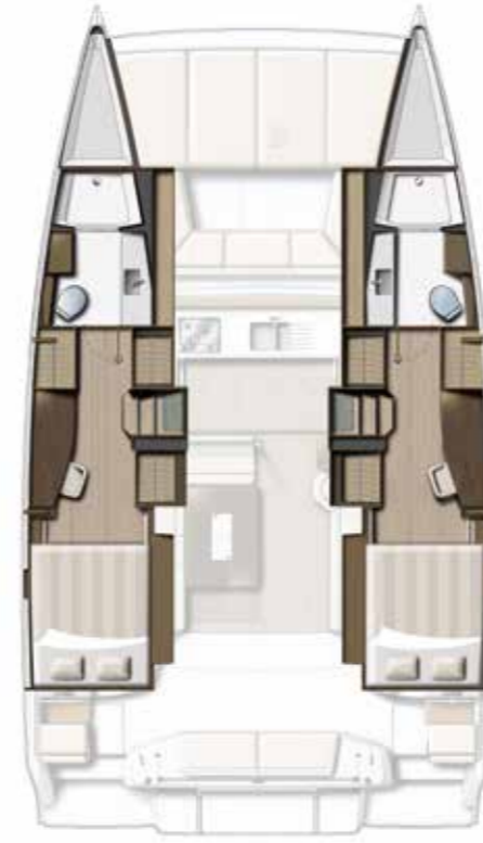
2 CABIN VERSION / 2 BATHS Version 2 cabines DOUBLES / 2 SDB