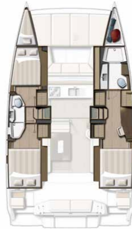
3 CABIN VERSION / 2 BATHS Version 3 cabines DOUBLES / 2 SDB